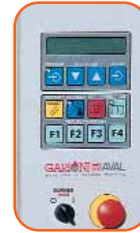
GN MONITORING AND MICROMODULATION SYSTEM